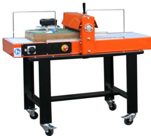
Cut 500 con carrello