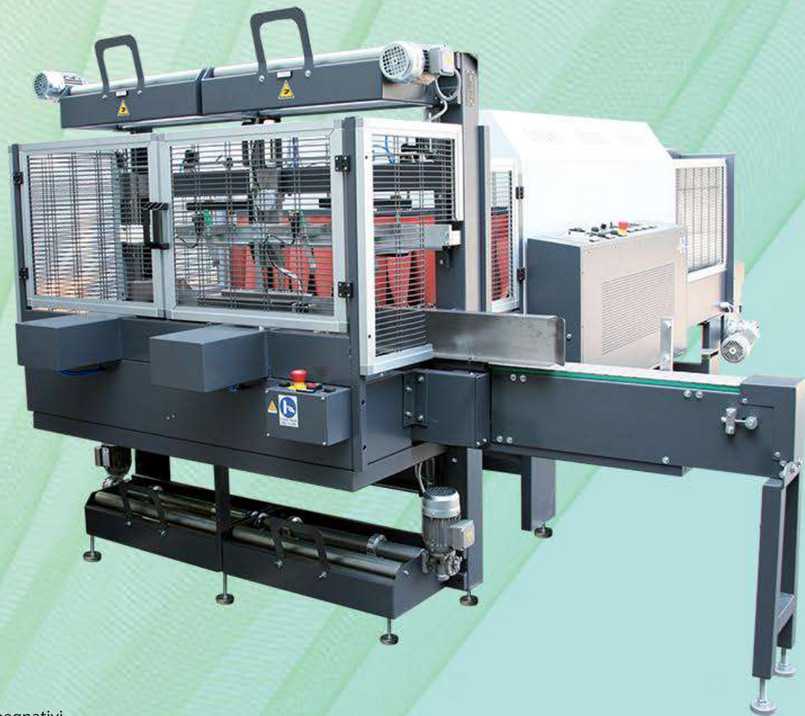
CAM 1250 CL DOPPIA STAZIONE