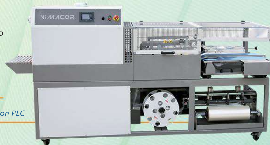
DYNAMIC 5038 MB con PLC

Le nostre confezionatrici automatiche possono essere comandate anche con PLC.