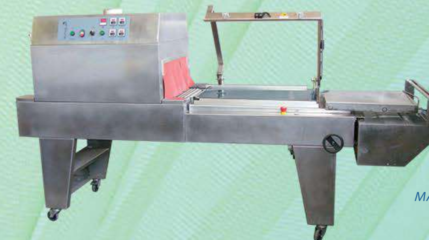
MATRIX 7550 INOX