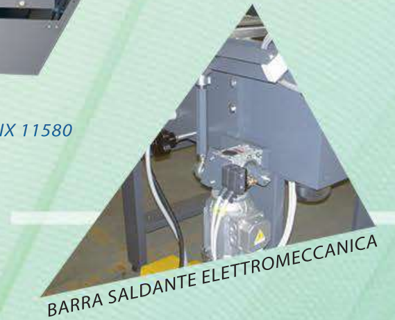
BARRA SALDANTE ELETTROMECCANICA

Le linee confezionatrici modello Matrix sono fornite in diverse dimensioni, realizzate in acciaio inox, con funzionamento elettromeccanico e con diversi sistemi di saldatura, permettono l'utilizzo di svariate tipologie di film tecnici saldabili a caldo per il settore farmaceutico, alimentare e altro.